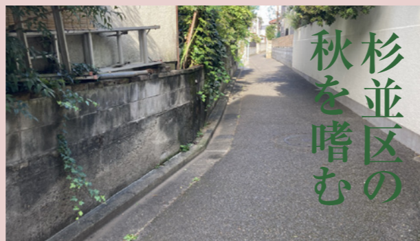
11月中旬の杉並区の家並み

私たちは「我が国には四季があり、それぞれに美しい彩を見せる」といった話を聞かされて大人になるわけですが、実際のところ、そのイメージというのは本当でしょうか。例えば秋ですと、葉っぱが黄色からオレンジ、赤になり、美しく見える…のですが、実際はそういう場所「も」ある、というのが正確で、周りを見ると、だいたいこんな感じでしょう↓