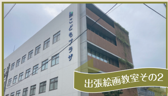
出張絵画教室その2

来年6月、江東区子どもプラザで講座を開くことになりました。お題はピクトグラム作り。小学生のみんなにも楽しく作ってもらえるように内容を考えます！